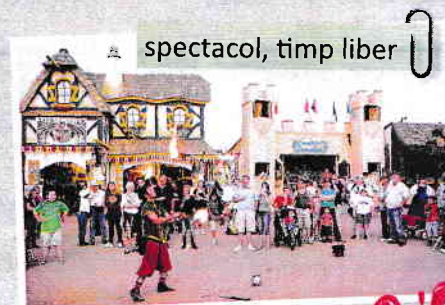
spectacol, timp liber

Informații pentru profesori la paginile 124-132