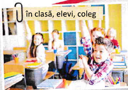
în clasă, elevi, coleg

Pe o coală A4 desenează sau lipește imagini care vorbesc despre vacanța ta. Adaugă cuvinte decupate din ziare. Prezintă lucrarea colegilor. Adunați toate lucrările într-un dosar-jurnal.