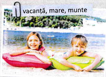
vacanță, mare, munte